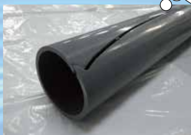
漏水した塩化ビニール管の損傷状況 (口径100mm)