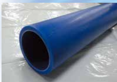
高密度ポリエチレン管 (主に口径100mm以下に使用)