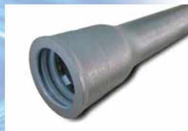
ダクタイル鋳鉄管・GX管 (主に口径150mm以上に使用)

高密度ポリエチレン管は、柔軟性があり地震にも強いんだって!ダクタイル鋳鉄管は、より強度があって主な幹線に使用するんだね!