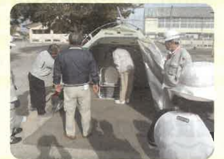
町内会の自主防災訓練と一緒に設置訓練をしていただきました!