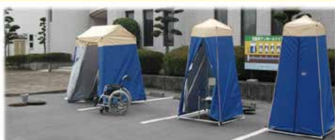
大村市地域防災計画指定避難所の小中学校に整備を実施しています。

災害が発生すると、断水や下水道管の損壊により水洗トイレが使えなくなることがあります。そのような非常時でもきれいに利用できるのが「 災害用マンホールトイレ 」です。災害時でも避難先で安心して利用できるトイレの整備に取り組んでいます。