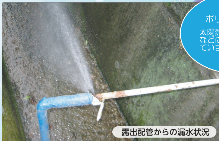
露出配管からの漏水状況

また、令和5年1月に発生した寒波事故では、件数412件、約79,320m 3 の漏水が発生しております。